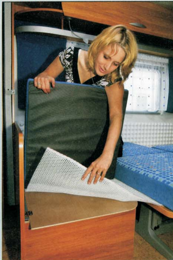
Unterlüftung: Die Polsterunterlage Calypso Aqua Stop von E-con verhindert Feuchtigkeit zwischen Sitzbank und Matratze.